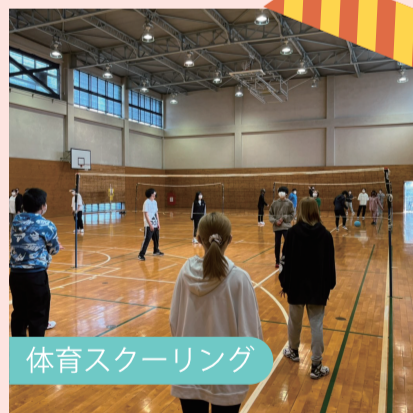
体育スクーリング