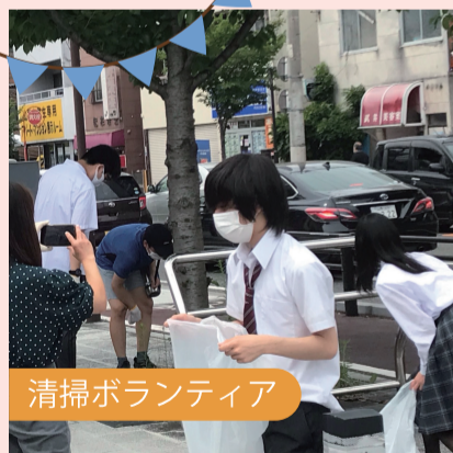
清掃ボランティア